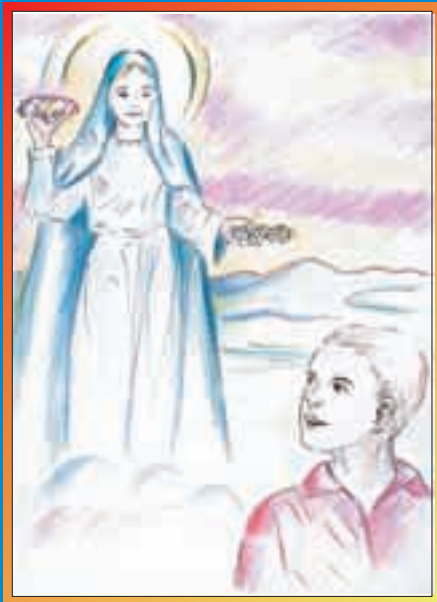
disegni e testi di Karmel